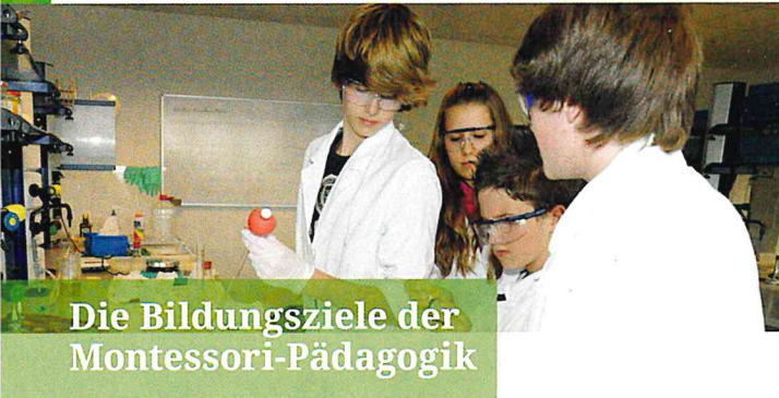
Die Bildungsziele der Montessori-Pädagogik